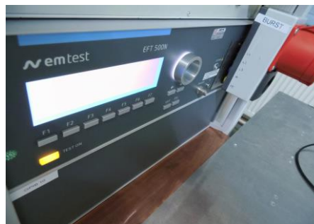
Ansicht Prüfplatz EN 61000-4-4 Burst