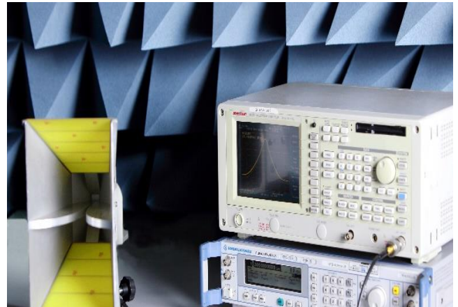
Automatisierter Prüfplatz heute

Die CE-LAB GmbH ist ein modernes Prüfzentrum für die Bearbeitung von Aufgabenstellungen in diesen genannten Fachbereichen mit dem Schwerpunkt Elektromagnetische Verträglichkeit, Gerätesicherheit und Blitz-/Überspannungsschutz. Die Ausrüstung ist ausgelegt für die Prüfung von Produkten der Informations- und KFZ-Technik, für Medizinprodukte und für industrielle Erzeugnisse.